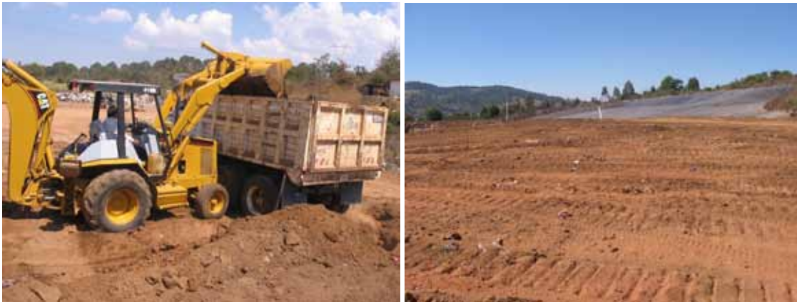
Cargando camiones con tierra para la cobertura de disposición final de los residuos.

Operación del relleno sanitario. El relleno sanitario se está operando de acuerdo como lo especifica la Norma Oficial mexicana NOM 083 SEMARNAT-2003, recolección, transporte, disposición final de los residuos, compactación, cubierta de tierra, monitoreo de gases y aspersión de lixiviados, etc.