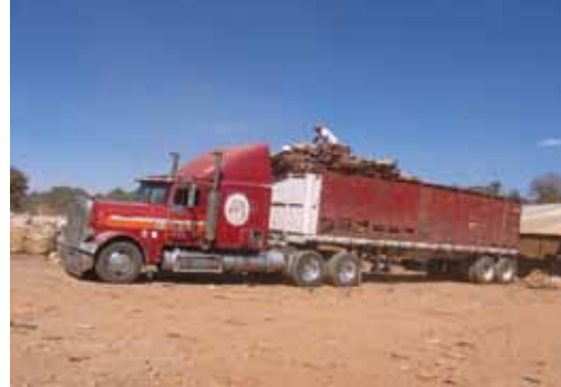
Tráiler con seis toneladas de cartón con destino Atenquique Jal, para su reciclado

Los desperdicios orgánicos conforman el 52% de los residuos, los cuales, gran parte se está aprovechando en la elaboración de composta y esta a la vez utilizarla como mejorador de suelos.