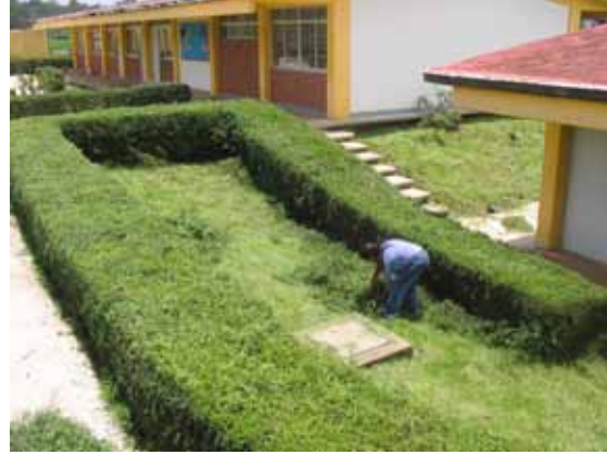
Poda del seto en arbolitos de cedro en la escuela Narciso Mendoza

De igual manera se dio mantenimiento a los espacios públicos, DIF. Municipal, Centro de Salud, Jardín Principal, Camellón Vicente Guerrero, Eduardo Montaña, Prolongación Galeana, Andador Mazamitla-Epenche Chico, Cementerio Municipal y otros.