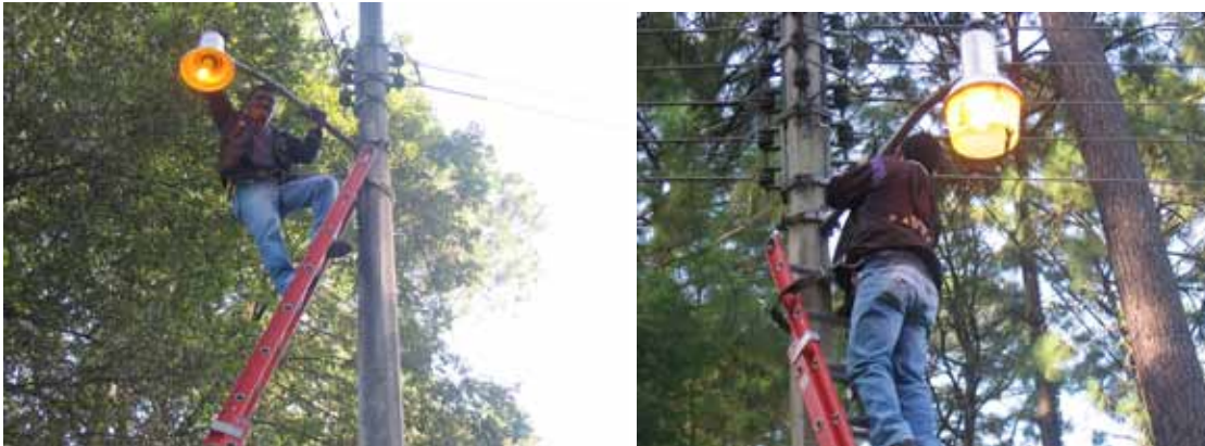
Reposición de focos en la comunidad del Terrero

Con motivo de las fiestas cívicas, eventos y todo tipo de celebraciones se trabaja intensamente sin tomar en cuenta horarios de trabajo, sino con el afán de satisfacer la demanda; La Feria de las Flores se trabajó en la colocación de reflectores en los diferentes escenarios para mayor lucidez de la feria.