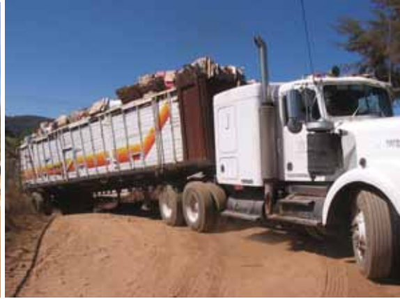
Tráiler cargado con cartón y camión + remolque con plástico PET con destino al reciclaje, todo este material es producto de los programas municipales de separación de los residuos, campañas de limpieza, información y difusión de prevención a la contaminación y a la salud.