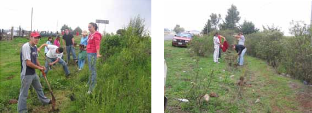
Reforestando laterales de las carreteras Estacada y Llano del Toro.

Cementerio Municipal. Se trabajó en la poda de pasto y árboles forestales que a petición de los usuarios afectan a sus gavetas con las ramas, se limpió de escombros residuos sobrantes de las construcciones, retiro de arreglos deteriorados como coronas arreglos florales de plástico, malezas y otros.