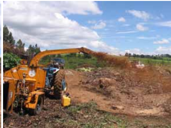
Máquina Chipadora triturando madera y ramas para la generación de molch, material especial para los jardines, también se incorpora a la composta.

Alumbrado Público. Se continúa trabajando en el mantenimiento de luminarias en todo el municipio ya que está cubierto el 95% con alumbrado público con 2,298 luminarias en los lugares más concurridos por la ciudadanía.