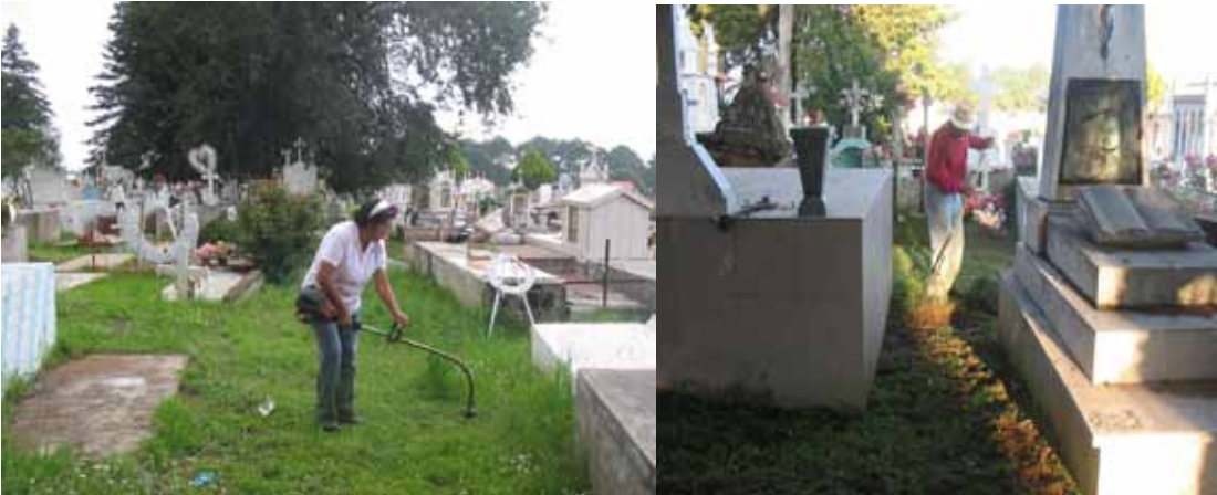
Poda de pasto y limpieza de escombros, basura, ramas y maleza en general

Parques y Jardines. Como complemento importante para las áreas recreativas se construyeron ocho pequeñas terrazas en el Parque Municipal La Zanja para proporcionar espacios agradables para toda la familia; Se cuenta con algunos atractivos para niños y jóvenes por ejemplo: Columpios, andadores, laberintos, juegos infantiles, puentes, plantas de ornato, etc.